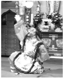
舞楽「抜頭」 ワンシーン